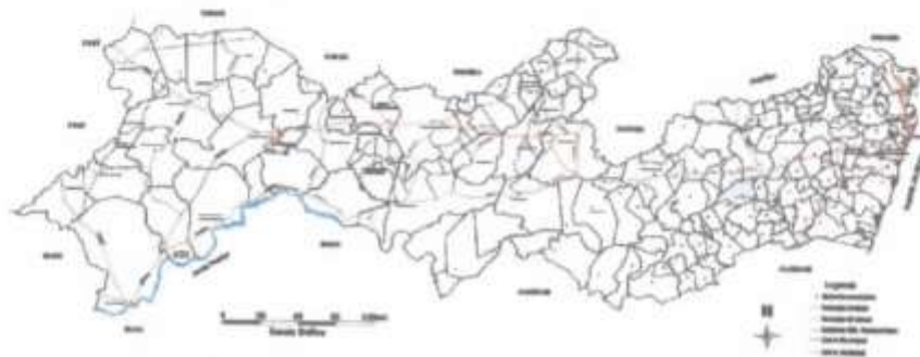
Figura 1 - Mapa de acesso rodoviário